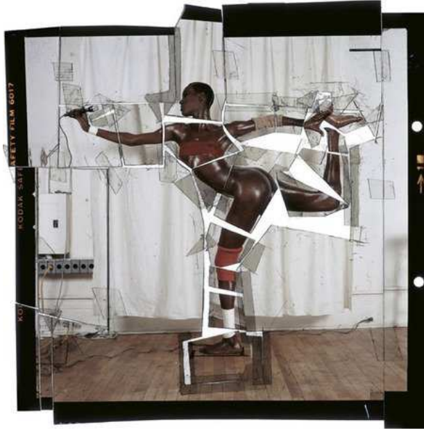
Jean-Paul Goude, Grace revue et corigee , imagine din seria Grace Jones , 1978

Jean-Paul Goude este exemplul cel mai puternic ca artistul/creatorul/fotograful care aduce în discurs și în demers, nu numai influențele fotografiei de către neo-figurativul din BD, ci chiar conjugarea și asistarea puternic partenerială a celor două secvențe identitare.